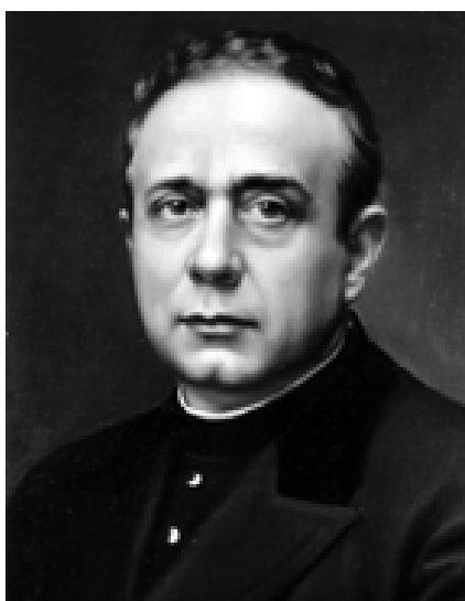
San Pedro Poveda

San Pedro Poveda captando la importancia de la función social de la educación, realizó una importante tarea humanitaria y educativa entre los marginados y carentes de recursos. Fue maestro de oración, pedagogo de la vida cristiana y de las relaciones entre la fe y la ciencia, convencido de que los cristianos debían aportar valores y compromisos sustanciales para la construcción de un mundo más justo y solidario. Culminó su existencia con la corona del martirio.