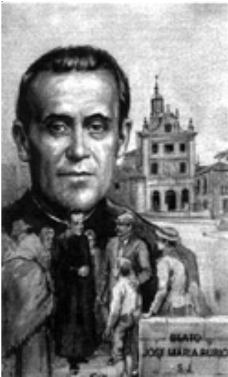
San José María Rubio

Semejante amor y sensibilidad hacia los pobres llevó a Santa Ángela de la Cruz a fundar su «Compañía de la Cruz», con una dimensión caritativa y social a favor de los más necesitados y con un impacto enorme en la iglesia y en la sociedad sevillanas de su época. Su nota distintiva era la naturalidad y la sencillez, buscando la santidad con un espíritu de mortificación, al servicio de Dios en los hermanos.