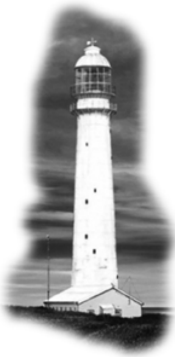
Faro Slangkop, Cape Town, Costa África del Sur

Estimado lector: Habiendo cumplido con la no fácil tarea de publicar 20 Boletines de Apuntes de Lectura Espiritual, frescos y variados, cumplimos con la promesa de entregarle el Boletín N° 2 con su faro aquí presente y algunos de sus artículos. Athletae Christi y su Consejo de Redacción agradecen la amable acogida que ha tenido esta publicación.