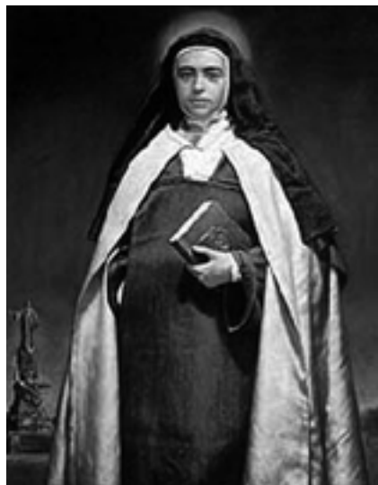
Santa Maravillas de Jesús