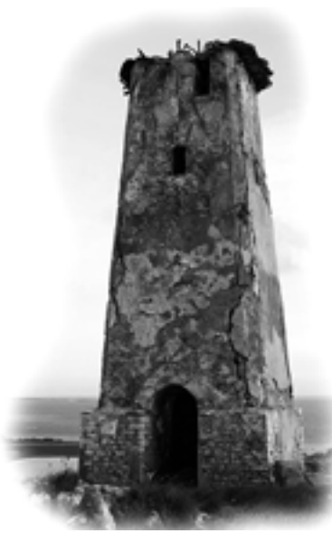
Faro antiguo de Los Roques

Estimado lector: Habiendo cumplido con la no fácil tarea de publicar 20 Boletines de Apuntes de Lectura Espiritual, frescos y variados, cumplimos con la promesa de entregarle el Boletín N° 1 con su faro aquí presente y algunos de sus artículos. Athletae Christi y su Consejo de Redacción agradecen la amable acogida que ha tenido esta publicación.