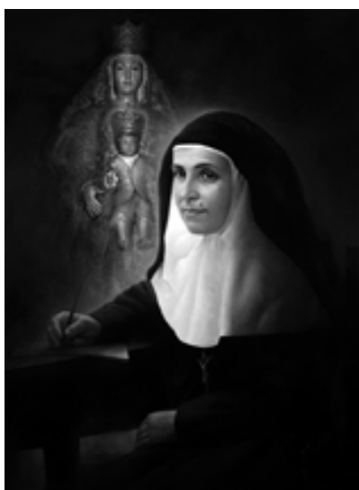
Santa Ángela de la Cruz