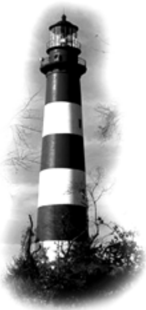
Faro Assateague Island, Maryland, Virginia. USA

Estimado lector: Habiendo cumplido con la no fácil tarea de publicar 20 Boletines de Apuntes de Lectura Espiritual, frescos y variados, cumplimos con la promesa de entregarle el Boletín N° 4 con su faro aquí presente y algunos de sus artículos. Athletae Christi y su Consejo de Redacción agradecen la amable acogida que ha tenido esta publicación.