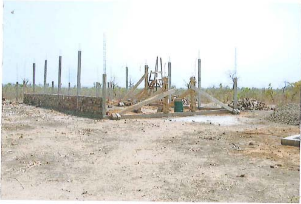
VISTA DE LA NUEVA CAPILLA