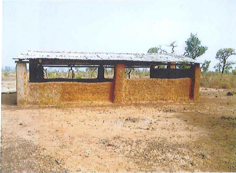
ANTIGUA CAPILLA CONSTRUIDA EN BARRO