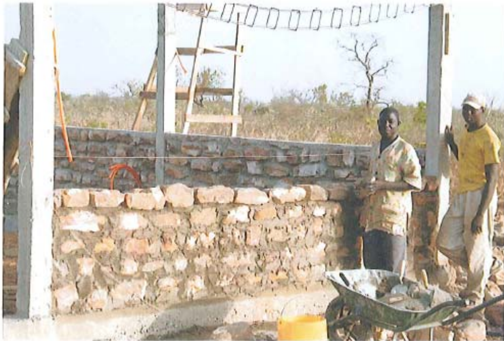
CONSTRUCCION EN PIEDRA DE LA NUEVA CAPILLA